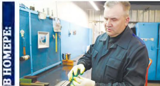
РАЦИОНАЛИЗАТОРСТВО: МЫСЛЬ В ДЕЙСТВИИ