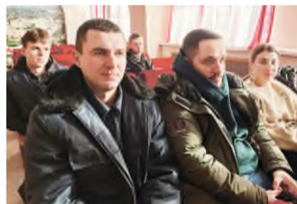
ИМЯ НА ДОСКЕ ПОЧЁТА

Представители цехов высказывали свои предложения по различным мероприятиям, которые находят отклик в молодежной среде. В числе интересующих направлений - творческие мастер-классы, ивенты, экскур-