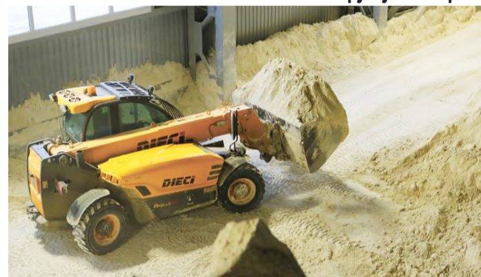
В цехе ВКНиОСВ работает участок по производству синтетического двухводного гипса

Для переработки минеральных строительных отходов во вторичный щебень различных фракций в ОАО «СветлогорскХимволокно» используется экскаватор, оснащенный гидромолотом и дробильным ковшом. Полученную продукцию применяют для укрепления дорог и в качестве изолирующего слоя на полигоне промышленных отходов.