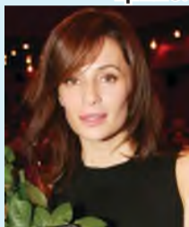
Оксана ФАНДЕРА, актриса.