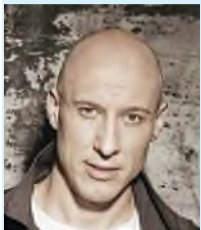
Денис МАЙДАЕНОВ, певец.