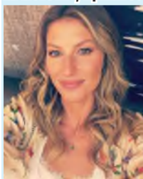
Жизель БЮДХЕН, модель.