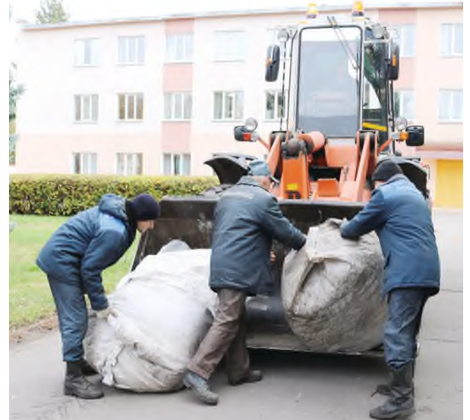
Работа у работников хозяйственной структуры Общества есть всегда, независимо от поры года.