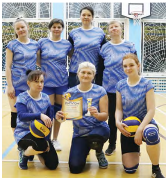
Спортсменки - победительницы ЦППП.