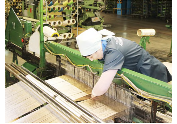
Во время конкурса профмастерства 2023 года.

Правда, один год было не до победы, почва ухлынула из-под ног. Это было лето 2019 года, когда