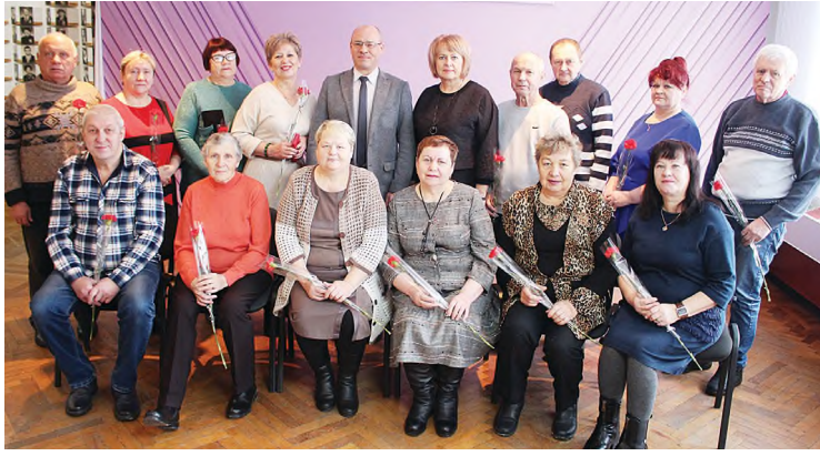
Ушедшая осень для 19-ти химиков ознаменовалась особым событием в их трудовой биографии – уходом на заслуженный отдых, и уже пришедшая зима для каждого из них будет наполнена новыми событиями и планами. В музее предприятия состоялись ноябрьские проводы.