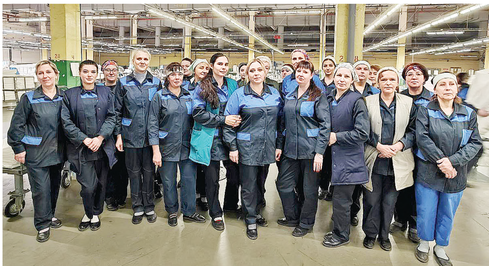
Коллектив смены №3 участка по пошиву упаковочной тары крутильно-ткацкого цеха всегда поддерживает друг друга.

По словам начальника цеха, работники смены часто в передовиках цеха, а еще они постоянные победители конкурсов