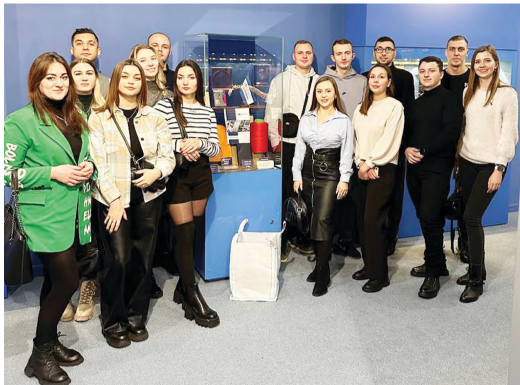
Молодёжь предприятия возле стенда с продукцией ОАО «СветлогорскХимволокно».

Химикам очень понравилась экскурсия, многие отметили только положительные эмоции после посещения музея.