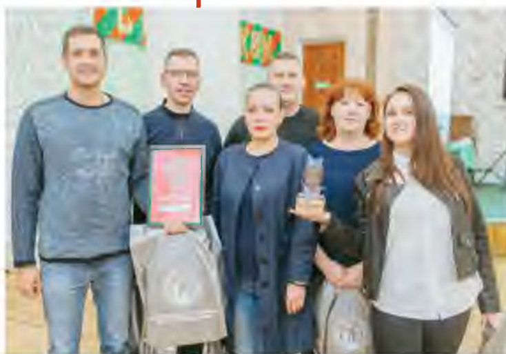
Победители паб-квиза команда «Полосатый рельс».