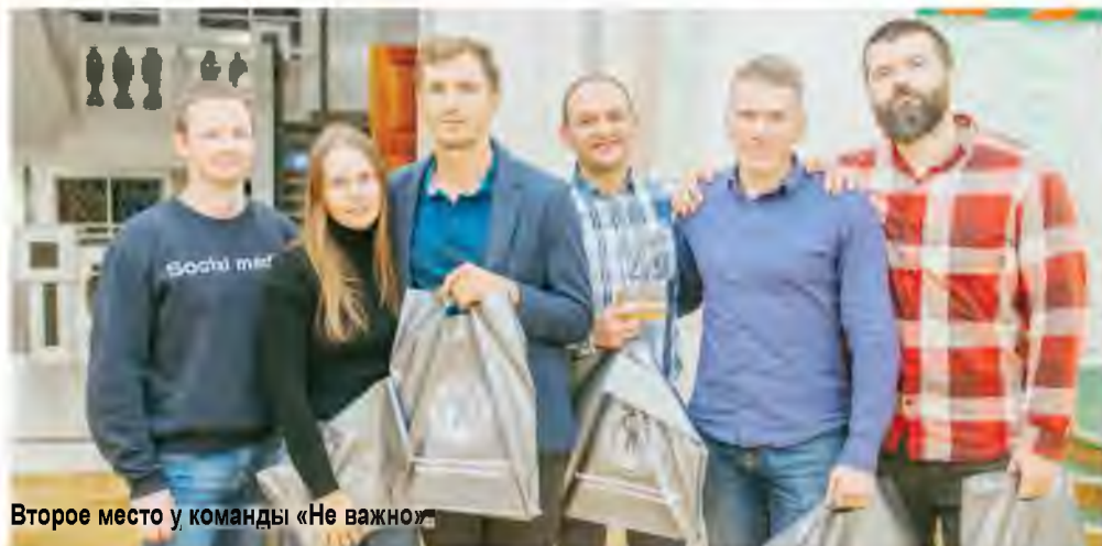
Второе место у команды «Не важно»