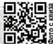
ФОТО С КВИЗА