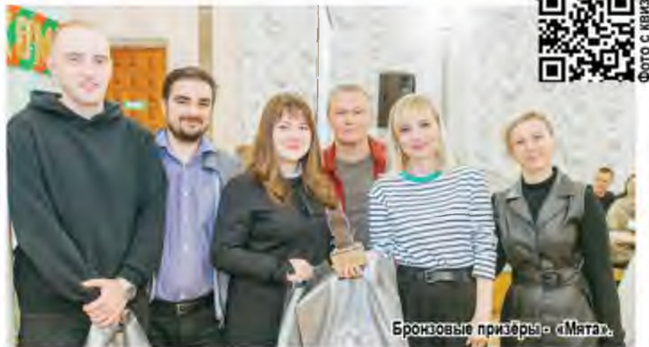
Бронзовые призёры - «Мята».