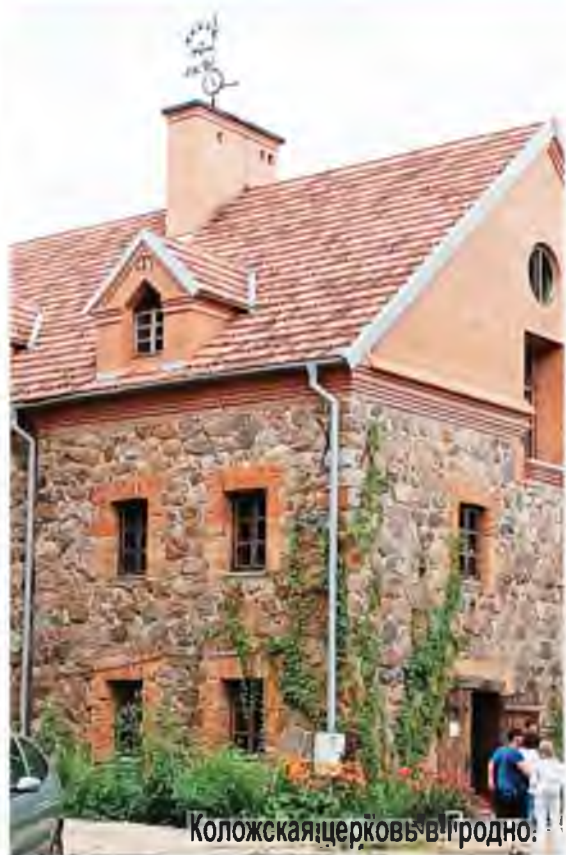
Коложская церковь в Гродно.

- 1 верасня мы з'ездзілі ў княства, якое называецца Сула. Сула – гэта рэчка, на беразе якой і вырастае гэты парк. Сустрэлі нас вельмі выдатна. Усё было святочна. Вельмі спадабалася, што экскурсія вялася на беларускай мове. Моцныя уражанні ад арганізацыі. Мы паспелі ўсё: нас каталі на лодцы – мы адчулі сябе вікінгамі; здзяйснялі абрады ачышчэння, палілі ў вогнішчы свае беды. Нас вучылі танчыць, граць на інструменце, якому 130 гадоў. Вадзілі ў калегіум, дзе расказвалі пра першадрукароў Францыска Скарыну і Івана Федарава і паказвалі кнігі, якія