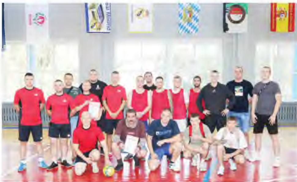
Победители и призёры Чемпионата Общества по мини-футболу.

Один из фаворитов турнира — команда ЦГВиТ — усту-