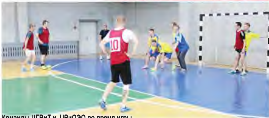
Команды ЦГВиТ и ЦРиОЭО во время игры.

пила в серии пенальти молодой и резкой команде ЦРиОЭО, которая благодаря этой победе впервые вышла в финал Чемпионата.