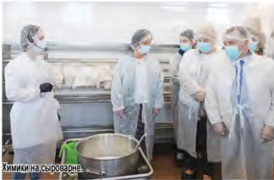
Химики на сыроварне.

Программа экскурсии была создана очень грамотной и рассчитана на любой возраст от 20 до бесконечности. В Лиде я был впервые и фестиваль меня не очень заинтересовал, но сама Лида произвела удивительное впечатление. Замечательный город, который можно изучать и изучать. В Гродно последний раз я был в 2010 году и, конечно, за это время город преобразился, стал еще красивее и ухоженнее. Замечательная экскурсия по Гродно позволила увидеть город, так сказать, глазами местного жителя. А в свободное время я гулял по гродненским паркам, общался с гродненцами. Отдельно хочется отметить место ночевки – «Дом рыбака». По названию можно подумать, что это совсем небольшой уголок, где есть кровать и стол. Однако, когда мы туда приехали ночью, уже были удивлены количеством площадок для отдыха как семьями, так и экскурсгруппами. А утром, прогулявшись по территории, убедились – шикарное место, где всё продумано до мелочей! Огромное спасибо профсоюзному комитету за кропотливо проделанную работу по организации такой великолепной экскурсии и обширной программы. Мне кажется, в таких местах как Гродно, Полоцк, Брест – должны побывать все белорусы, увидеть своими глазами, чем богата и славна белорусская земля.