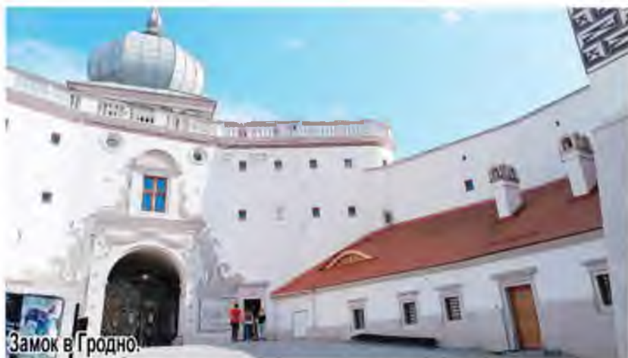
Замок в Гродно.

Для тех, кто не был, это место – обязательно для посещения! Парк Сула – это не совсем парк в традиционном представлении (где растут деревья и кустарники). И не парк развлечений в классическом его понимании (с горками и каруселями). Это интерактивный исторический парк, на территории которого возведены массивные здания