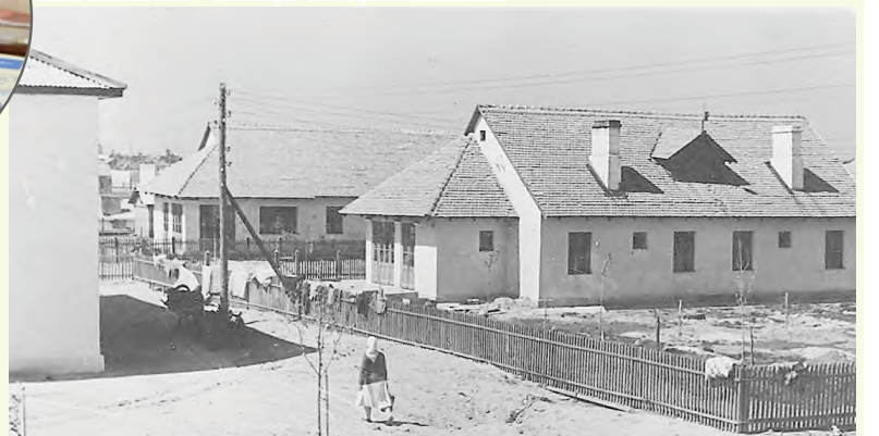
Первые дома (улица Ленина).