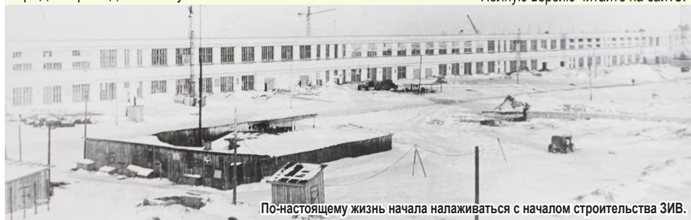
По-настоящему жизнь начала налаживаться с началом строительства ЗИВ.