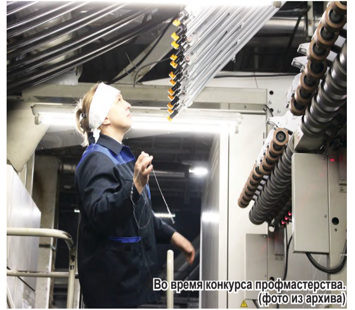
Во время конкурса профмастерства.