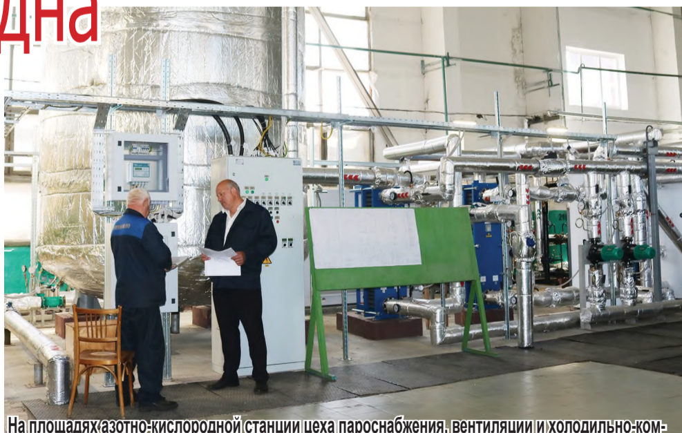
На площадях азотно-кислородной станции цеха пароснабжения, вентиляции и холодильно-компрессорного оборудования запущена теплонасосная установка.

По оценке Мирового энергетического комитета, уже в ближайшие пять лет доля отопления и горячего водоснабжения от тепловых насосов будет составлять в развитых странах не менее 75%.