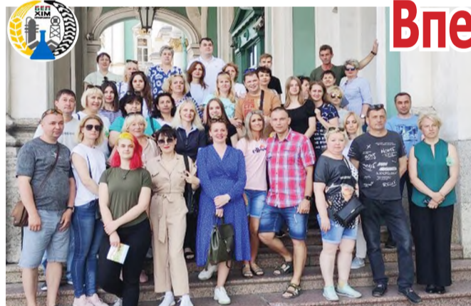
С 15 по 19 июня состоялась поездка химиков в Санкт-Петербург, организованная профсоюзным комитетом предприятия.

Хочу сразу выразить благодарность нашему профсоюзному комитету за организацию таких поездок. Питер – это неопишимо красивый город, с большим количеством достопримечательностей и уникальной историей. В этот году ему