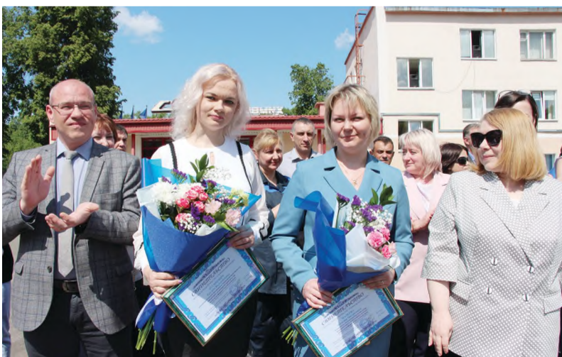
Под открытым небом состоялось торжественная церемония награждения химиков, чьи имена занесены на Доску почёта ОАО «СветлогорскХимволокно».