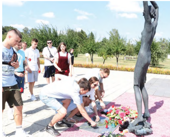
Молодёжь предприятия возложила цветы к мемориалу в Красном Береге.

Молодёжная акция Белхимпрофсоюза началась с посещения мемориального комплекса «Ола», построенного на месте уничтоженной фашистами деревни. Здесь, 14 января 1944 года, немцы сожгли и расстреляли 1758 человек, из них 950