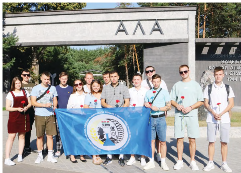
Молодёжный актив ОАО «СветлогорскХимволокно» на мемориальном комплексе «Ола».

у детей от 8 до 14 лет. Более 1990 детей прошли через Красный Берег. Поэтому именно здесь, недалеко от имения, в яблоневом саду расположился мемориальный комплекс памяти всех детей, чьё детство навсегда забрала война. Химики с интересом слушали экскурсовода, от некоторых рассказанных фактов злодеяний фашистов было невозможно сдержать слёзы. На молодежь предприятия произвел яркое впечатление «Мертвый класс» и письмо 15-летней девочки