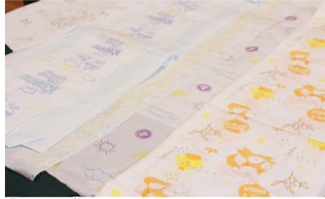
Дышащий материал для гигиены.

В изделиях гигиенического назначения нетканые материалы находятся в прямом