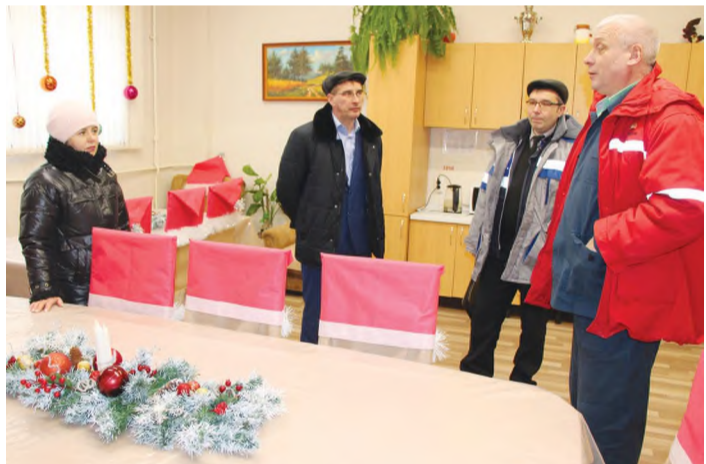
Комиссия по подведению итогов конкурса осматривает комнату приёма пищи ЦППП ЗИВ.

Смотр-конкурс на лучшее структурное подразделение по санитарному состоянию бытовых помещений и комнат приёма пищи – это ежегодный конкурс, призванный определить лучшие структурные подразделения, которые проводили на протя-