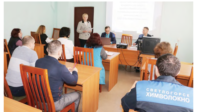
Во время проведения семинара.

Инспектора проинформировали о вступающем в силу с 1 января 2023 года Законе Республики Беларусь от 14 октября 2022 года № 213-З «О лицензировании», о необ-