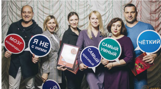
Третье место заняла команда «Лечебный корпус» санатория («Серебряные ключи»).

- Игра очень понравилась. Хотя большинство участников «Полосатого рельса» на регулярной основе играют в квизы, но данный формат мы попробовали впервые. Разная сложность вопросов позволяет никому не чувствовать себя лишним на этом празднике интеллекта и юмора. Время игры пролетело весело, интересно и незаметно. И день проведения был выбран удачно.