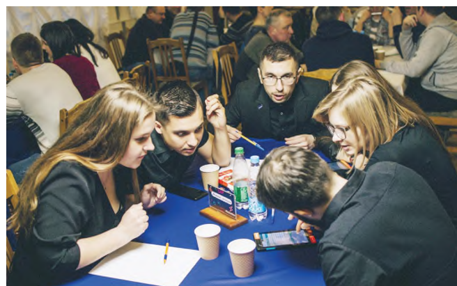
Молодёжная команда «Тёмная лошадка» увлечена обсуждением.

А самое главное, что игра не закончилась последним вопросом. Кого-то она мотивирует на получение новых знаний, кто-то обратит внимание на то, что вечер пятницы можно провести с пользой для ума, а