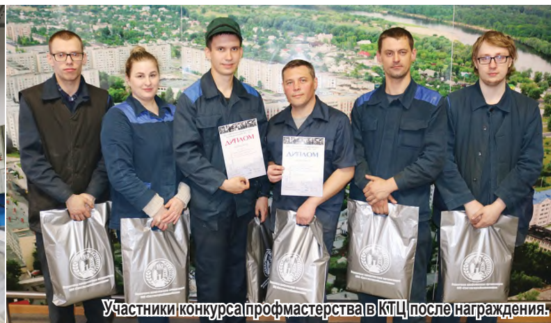
Участники конкурса профмастерства в КТЦ после награждения.

В прошлом году на участке по пошиву упаковочной тары крутильно-ткацкого цеха ЗИВ впервые состоялся конкурс профмастерства по профессии машинист автоматизированных линий. Пролетел год, и вновь представители этой профессии вышли на стартовую линию конкурса.