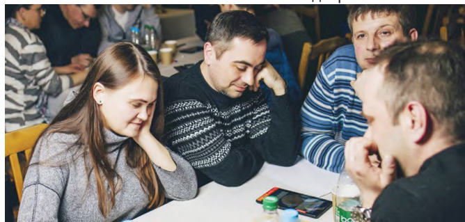
Команда «Химический состав» в игре.

- Замечательная игра от бобруйских «штурмовиков головного мозга». Даже с учётом регулярного посещения аналогичных мероприятий в Светлогорске было очень приятно окунуться в иную механику уже знакомой игры.