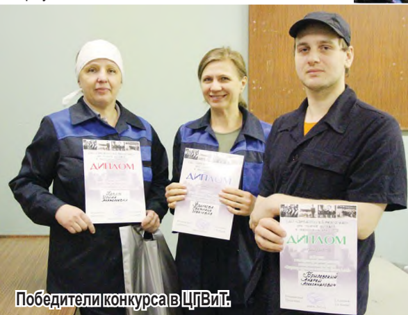
Победители конкурса в ЦГВиТ.

— Сегодня все показали хорошие результаты, борьба была напряжённая, всё решали доли секунд, — подводя итоги, отметила замести-