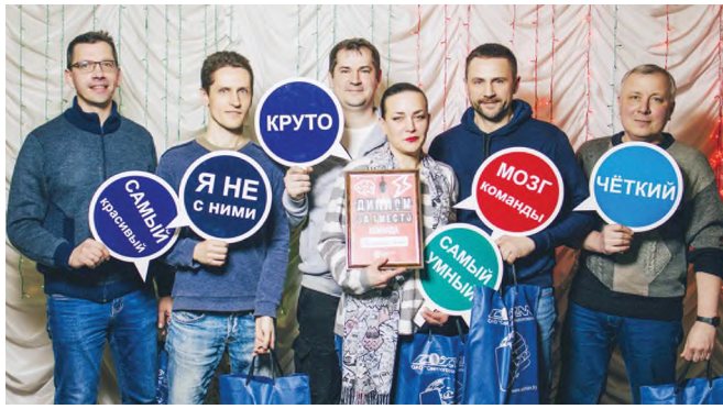
Команда - победитель «Полосатый рельс» ЗПТН.