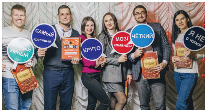
Второе место заняла команда «Центр управления» (управление).

Вопросы были несложные, но приходилось быстро думать, напрягая мозговые клетки, чтобы вспомнить то, что когда-то было известно или провести логическую цепочку, глядя на предложенные картинки, что бы угадать их общую тематику. Спасибо учредителям интеллектуального турнира! Было всё очень круто! Если пригласят, то мы обязательно поучаствуем в турнире ещё раз!