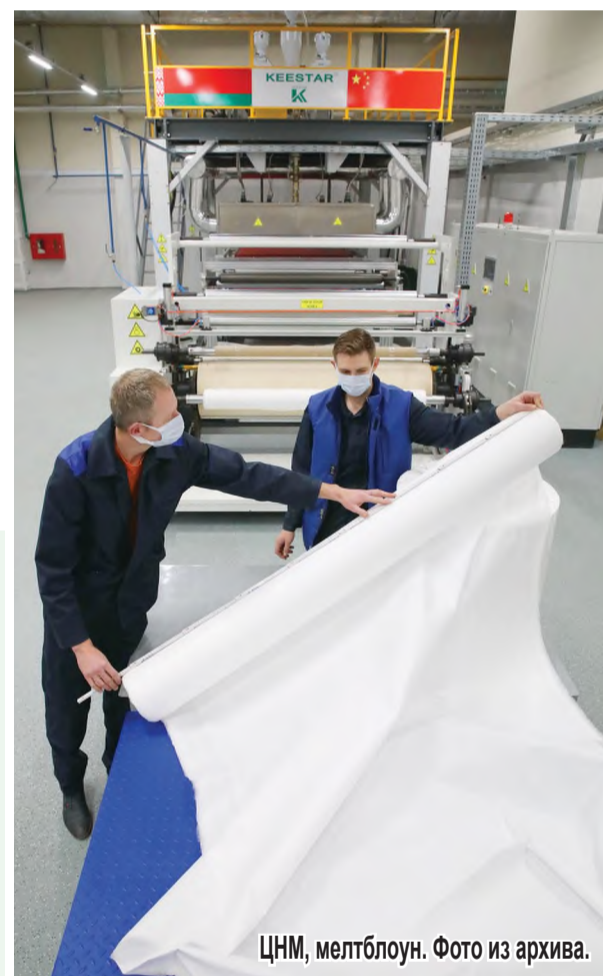
ЦНМ, мелтблун.

Проведена комплексная проверка состояния промышленной безопасности в ЦНМ с выдачей предписания, отмечено 10 нарушений требований ТНПА в области промышленной безопасности. Все нарушения устранены в установленные сроки.