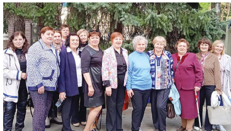
Ветераны предприятия в Ботаническом саду Беларуси.

Желаем ОАО «СветлогорскХимволокно» дальнейшего процветания, а молодому поколению - крепить наши традиции, добиваться ещё больших успехов в развитии завода, чтобы уже ваши дети с гордостью говорили: «Мои родители работали на «Химволокно»!