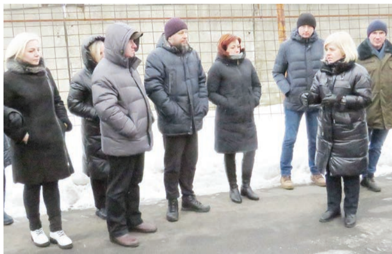
Во время практической части семинара.