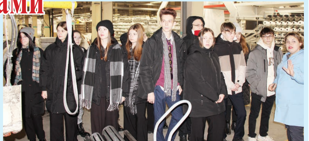
Десятиклассники в цехе по производству полипропиленовой продукции.

По итогам экскурсии, многие признались, что задумались о выборе профессии, которая связана с ОАО «СветлогорскХимволокно».