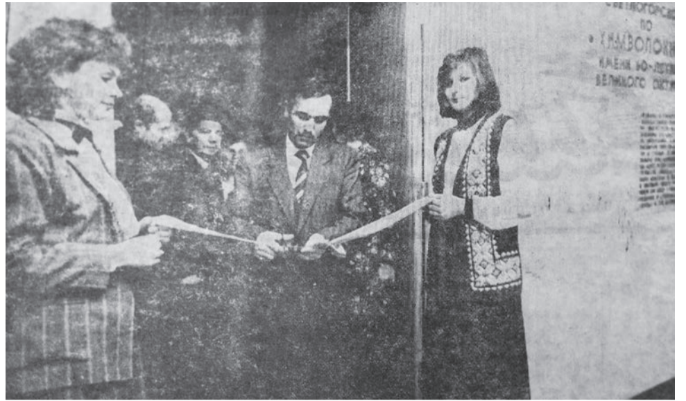
Открытие музея.

рий-профилакторий, интерьеры цехов, занимались внешним оформлением территории предприятия, улиц, закрепленных за объединением, и многим другим. На создание музея у