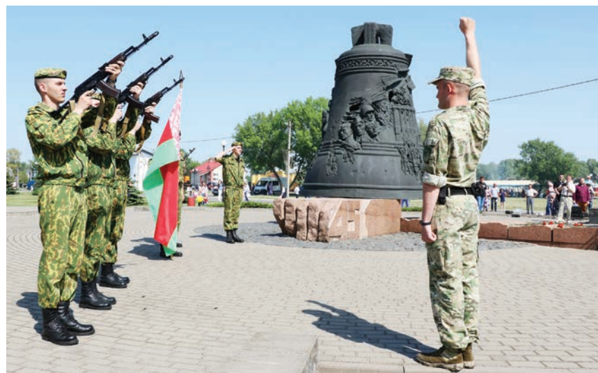
Мемарыяльны комплекс «Набат вечнай славы». Дзень Перамогі. 2018 год. Архіў.

Цытуем: «напярэдадні адкрыцця манумента (напярэдадні 60-й гадавіны Перамогі), калі сам звон быў ужо замантаваны, але будаўнічыя работы яшчэ вяліся, гараджане працягнулі да яго вялікую цікавасць. Кожны наравіў удариць у маленькі, «жывы» звон, які схаваны пад купалам вялікага. У гэтым заключаецца яшчэ адзін сімвалічны мо-