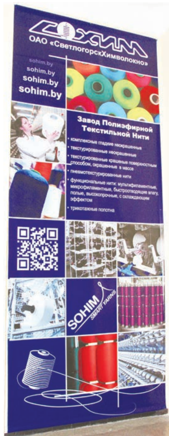
Плакат на лестничном пролёте при входе в фойе.

Потолки в актовом зале высокие, у завода не было возможности своими