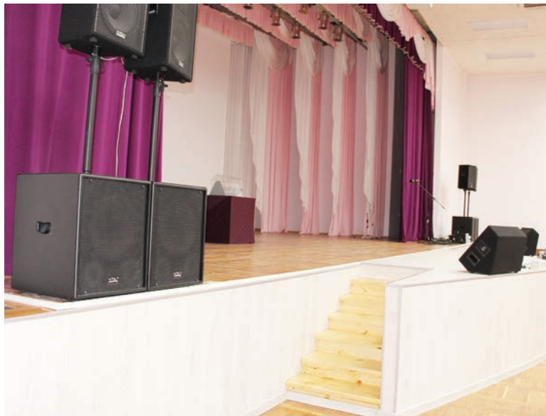
Ведущие на сцену ступеньки приведены в соответствие со строительными стандартами.

силами выполнить эту работу, поэтому просили оказать содействие службу главного метролога, - отметил руководитель ЗПТН.