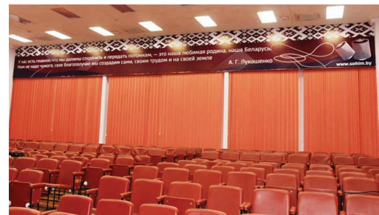
Для изготовления плакатов, слоганов привлекался отдел маркетинга.