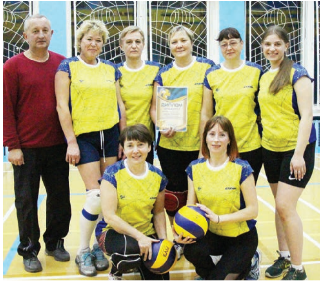
Команда Управления - победитель.

В четвёртой группе команда ЦППП переиграла спортсменок из КТЦ, а волейболистки Светлотекса одержали победу над командой ЦКиТП. Следует отметить, что УП «Светлотекс» — единственное из унитарных предприятий, принимавшее участие в чемпионате, за что им честь и хвала. В борьбе за выход в полуфинал победу одер-