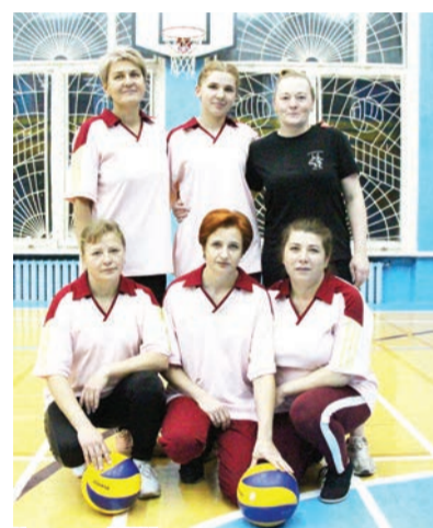
Команда ХПЦ, занявшая третье место.

Итак, команда управления — чемпион Общества по волейболу среди женщин! Второе место у команды цеха по производству полипропиленовой продукции. На третьем месте команда химико-пряделного цеха.