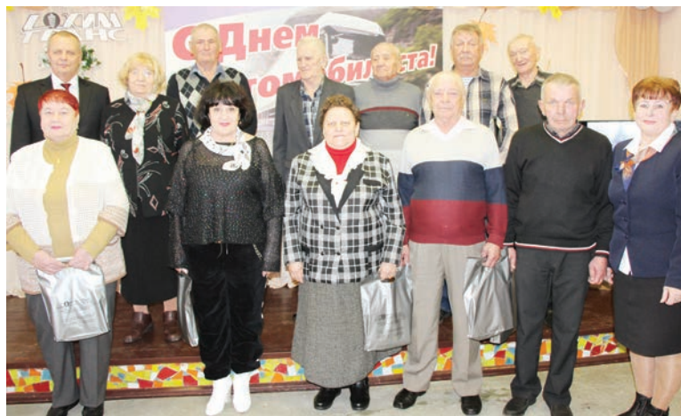
Ни один День автомобилиста в ТЭУП «СохимТранс» не проходит без ветеранов коллектива.

на то, что автомобиль давно и прочно вошёл в жизнь человека, День автомобилиста относительно молодой праздник.