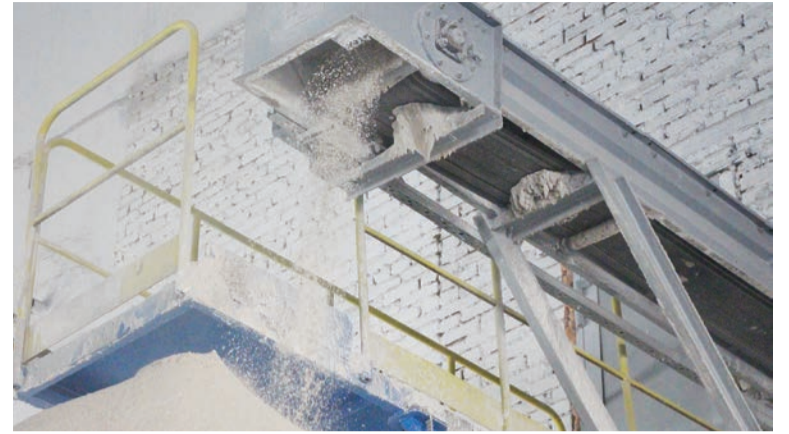
Процесс создания гипса двухфазного синтетического.

в действующие ТУ можно гораздо быстрее. Это позволяет нам оперативно адаптировать документы к быстро меняющимся внутренним и внешним факторам.