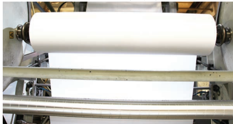
Процесс создания нетканого дублированного материала «МедиСпан».

Государственный стандарт, имея целый ряд положительных моментов, является очень инертным документом. Срок его разработки или внесения изменений может занимать годы. Разработать ТУ на новую или модифицированную продукцию, внести изменения