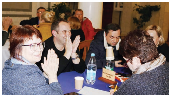
Третье место у команды «Неслучайные люди».