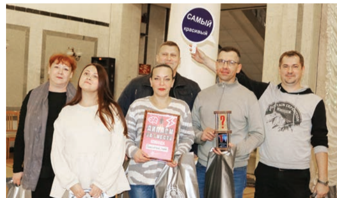
Победители квиза команда «Полосатый рельс».