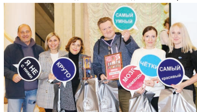
Команда санатория «Серебряные ключи» «Лечебный корпус» заняла второе место.

Материалы полосы подготовила Ольга МОРОЗ.