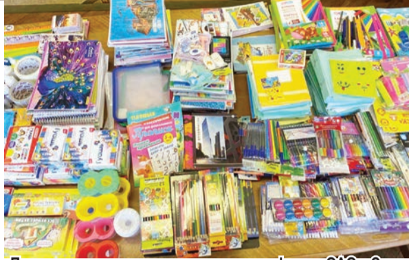
Представители администрации и профкома ОАО «СветлогорскХимволокно» посетили Светлогорский центр коррекционно-развивающего обучения и реабилитации для детей инвалидов и социально-педагогический центр, поздравили ребят с наступающим новым учебным годом и вручили собранные работниками канцелярские товары.