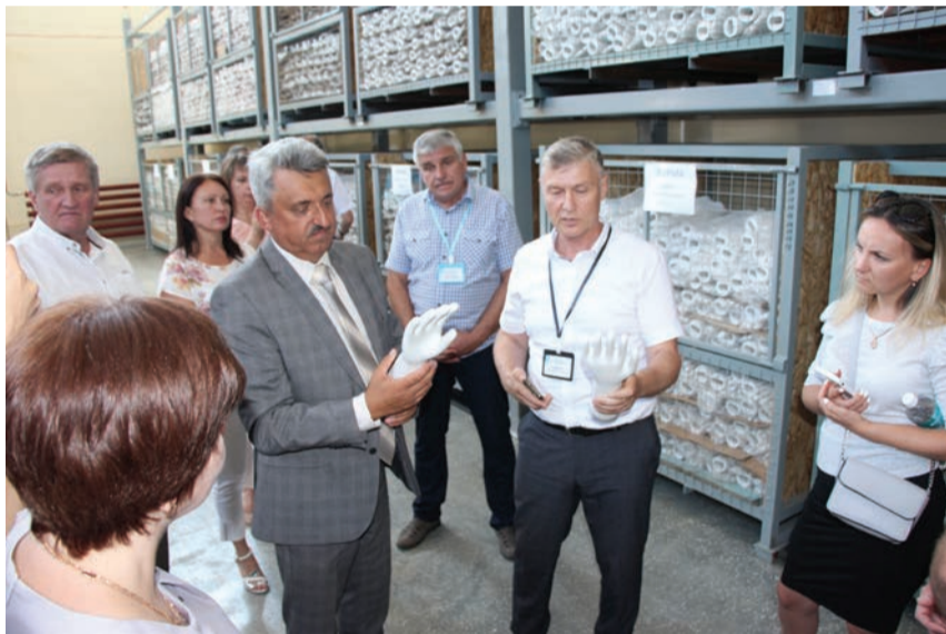
В ходе рабочей встречи представители ведущих организаций здравоохранения посетили цех по производству медицинских перчаток.