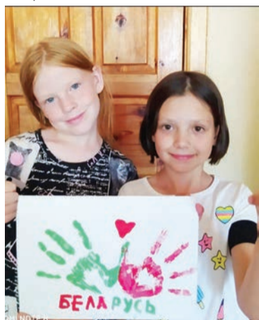
встреча с коллективами

«Под звук горнов и дробь барабанов юные ленинцы выносят пионерское знамя. Высоко над площадью поднимается флаг...» - так начиналась история по-прежнему юного, несмотря на свои 55, любимого многими поколениями детворы пионерского лагеря «Чайка». Архивные публикации заводской газеты рассказывали о том, как старались строители в срок сдать объекты, как работники завода искусственного волокна, чьи дети мечтали скорее поехать в лагерь, помогли на стройке. Время летит, и сегодня тем, кто