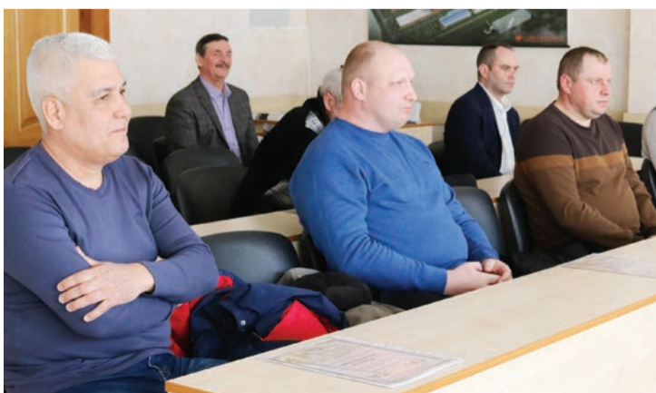
Рационализаторы предприятия во время награждения.