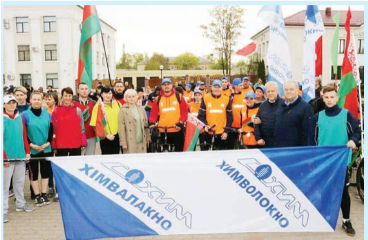
Работники ОАО «СветлогорскХимволокно» приняли участие в велопробеге и легкоатлетическом забеге «Родные символы», приуроченных ко Дню Государственного герба Республики Беларусь и Государственного флага Республики Беларусь.