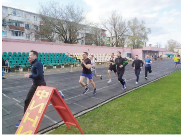
ЦППП – 873,1 очко, третье место у команды ЦНМ с результатом 870 очков.

По итогам общекомандного зачёта победу одержала команда управления с результатом 909,85 очков, на втором месте команда