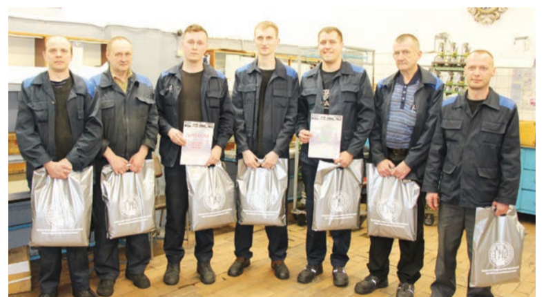
Конкурсанты-слесари после награждения.

профессионального мастерства, позволяющего работникам отточить практические навыки и проверить свою теоретическую подготовку.