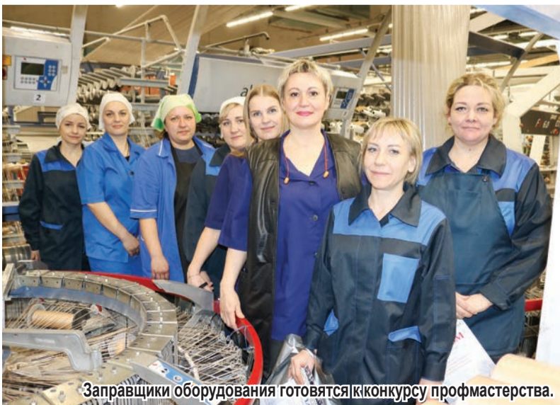
Заправщики оборудования готовятся к конкурсу профмастерства.

В ЦТО выбрали «Лучшего по профессии» среди слесарей-ремонтников.