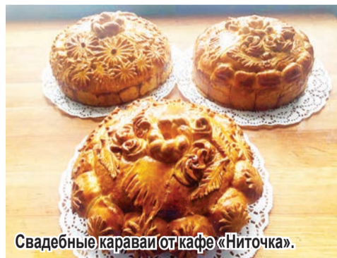
Свадебные караваи от кафе «Ниточка».

заказать еду на вынос, для этого в наличии имеется одноразовая посуда.