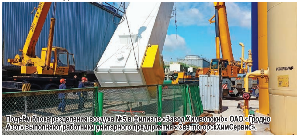
Подъём блока разделения воздуха №5 в филиале «Завод Химволокно» ОАО «Гродно Азот» выполняют работники унитарного предприятия «СветлогорскХімСервис».

Ежегодно Ремонтно-производственное унитарное предприятие «СветлогорскХімСервис» принимает участие в реализации проектов на предприятиях Беларуси. Не исключением стал и 2021 год.