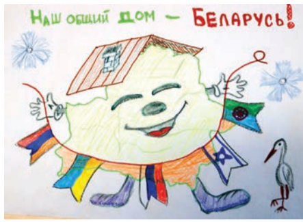
Дарья ВАГА, 7 лет.