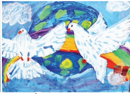
Валерия ВОЙТЕШЕНКО, 6 лет.