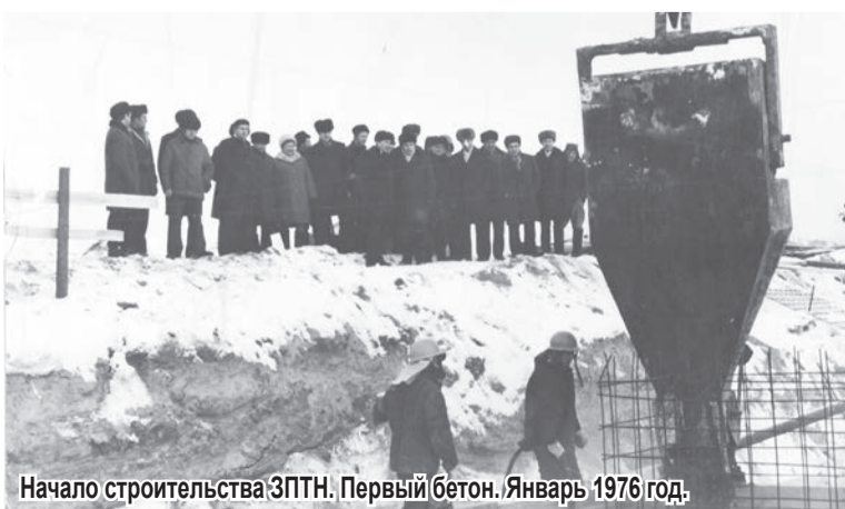
Начало строительства ЗПТН. Первый бетон. Январь 1976 год.