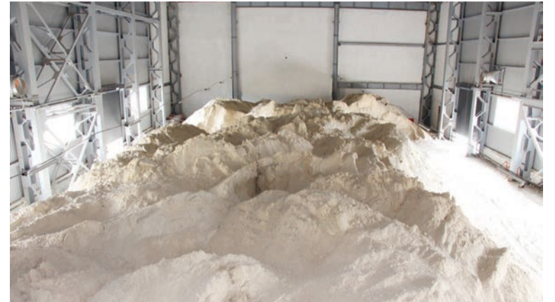
Склад готовой продукции.