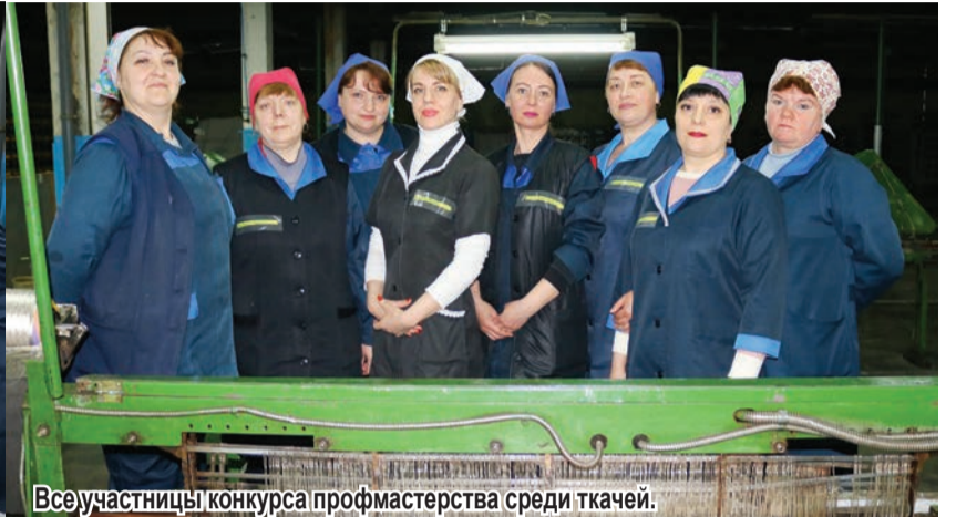
Все участницы конкурса профмастерства среди ткачей.