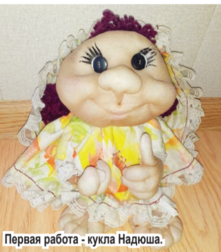
Первая работа - кукла Надюша.

- Планирую сделать куклы для дочерей, которые, к слову, у меня тоже рукодельницы, - добавляет химик. - Старшая рисует и вяжет спицами, младшая - крючком. Одно время