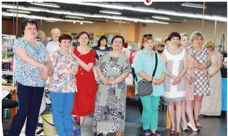
Больше фото на сайте http://himiki.sohim.by и в соцсетях

2019 году ШПУП «Светлотекс» вошло в число победителей районного соревнования среди трудовых коллективов Светлогорщины.