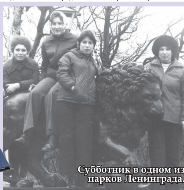
Субботник в одном из парков Ленинграда.

Студенчество в северной столице России, прекрасном городе Питере для меня – это и белые ночи, и приобщение к поистине неземным культурным ценностям, это и лыжные катания с Кавголовских гор, и студотрядовские будни, конечно. А такое золотое явление, как студенческое братство, которое не прерывается всю жизнь!