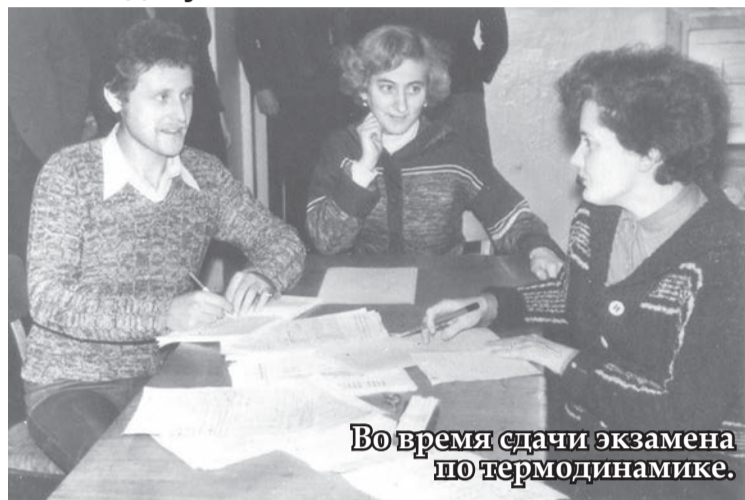
Во время сдачи экзамена по термодинамике.

25 января вся студенческая общественность празднует Татьянин день или День студента - праздник тех, кто молод душой и полон энергии. Многие считают студенческие годы самыми веселыми и беззаботными, а воспоминаниями о студенческой юности делятся с друзьями и знакомыми на протяжении долгих десятилетий. В преддверии Дня студента сотрудники предприятия вспоминали годы учебы.